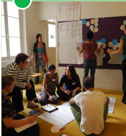
Formation Animer son partenariat - Déc 2015

Réseau AMAP Ile-de-France 47 avenue Pasteur - 93 100 Montreuil 09 52 91 79 95 • contact@amap-idf.org www.amap-idf.org