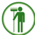
Visite de ferme