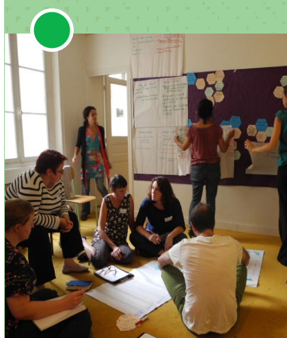
Formation Animer son partenariat - Déc 2015

Réseau AMAP Ile-de-France 47 avenue Pasteur - 93 100 Montreuil 09 52 91 79 95 • contact@amap-idf.org www.amap-idf.org